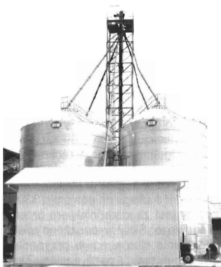
Foto 1. Magazyn nasion rzepaku w układzie gniazdowym oparty na silosach BIN 500.

W ostatnich latach, wraz z pojawieniem się koncepcji produkcji ekologicznego paliwa na bazie nasion rzepaku, dynamicznie rozwija się uprawa rzepaku w gospodarstwach indywidualnych, często nieposiadających bazy suszarniczo-przechowalniczej. Istotne różnice cech fizycznych nasion rzepaku w porównaniu z ziarnem zbóż (poziom bezpiecznej wilgotności, różnice w gęstości usypowej, opór warstwy nasion i in.) muszą być uwzględnione w przypadku adaptacji lub bazowania na układach magazynowych przeznaczonych dla ziarna zbóż. Nasiona rzepaku stawiają również inne wymagania w ciągu technologicznym przechowalni (kosz przyjęciowy, czyszczalnia, instalacja suszarnicza, układ silosowy) pod względem uzyskiwanych wydajności i przepustowości.